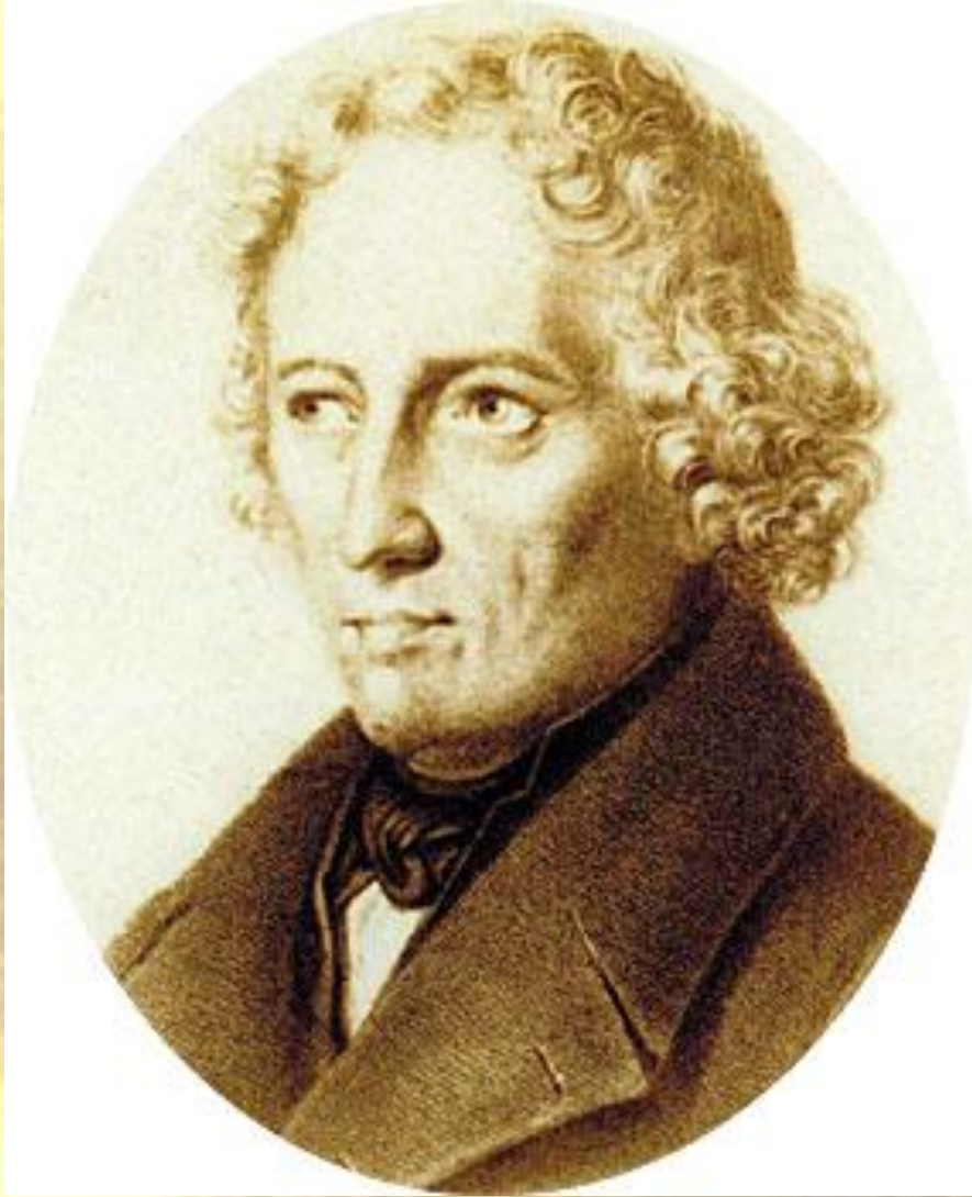
Jacob Ludwig Karl Grimm (4.1.1785- 20.9.1863)

deutscher Sprach- und Literaturwissenschaftler sowie Jurist