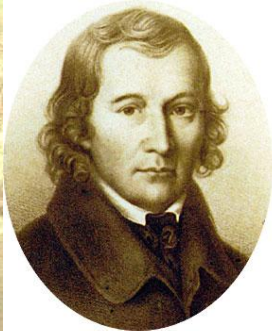
Wilhelm Karl Grimm (24.2.1786 - 16.12.1859)

deutscher Sprach- und Literaturwissenschaftler sowie Jurist